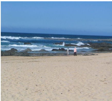
Strandwanderung in Kapstadt