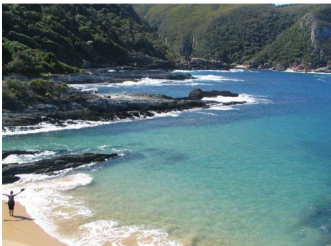
Storms River Mouth-Tsitsikamma

Ü/F im Tsitsikamma National Park - Storms River Mouth . Restaurant vor Ort