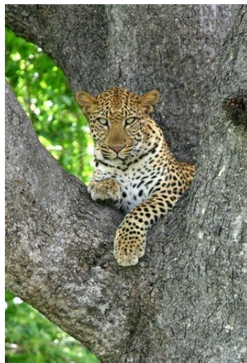
Leopard im KNP