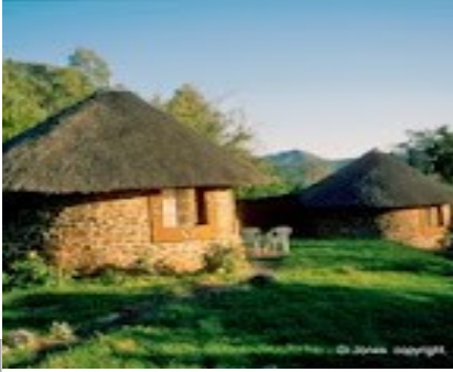
Basotho Hütten in Lesotho