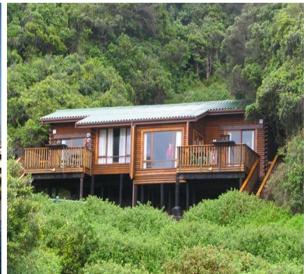
Unterkunft im Tsitsikamma NP