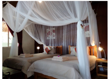
Island Safari Lodge Chalet