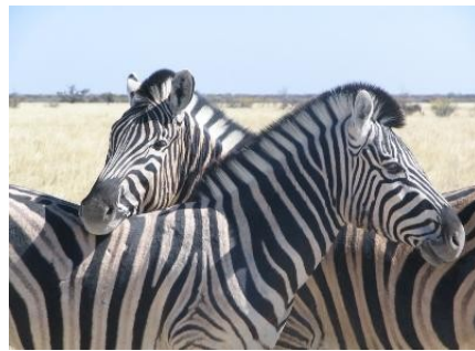
Zebras ruhen sich aus