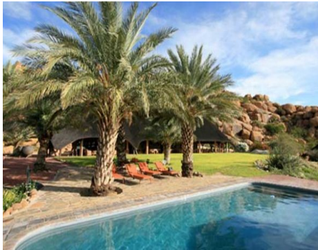
Ai Aiba Lodge Pool

Ü - H/P in der schön gelegenen Ai Aiba Lodge