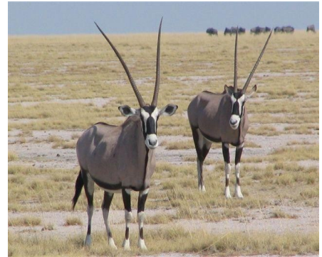
Spießböcke in Etosha