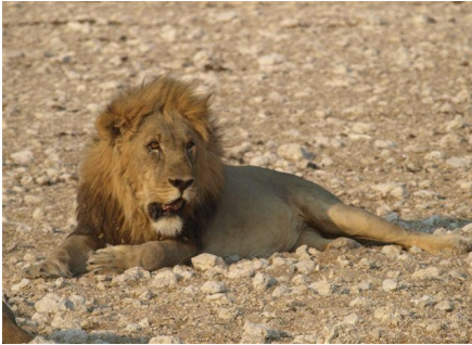
Kalahari Löwe in Etosha