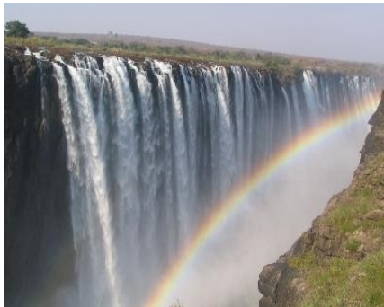
Regenbogen - Victoria Fälle