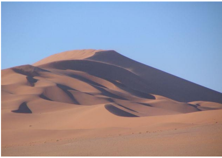
Sterndünen bei Sossusvlei