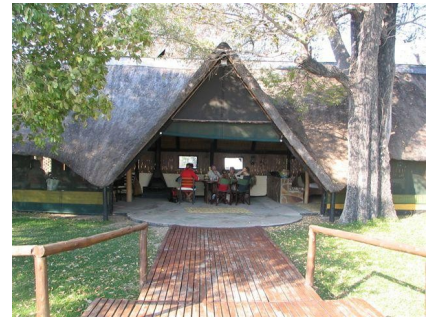
Ndhovu Safari Lodge