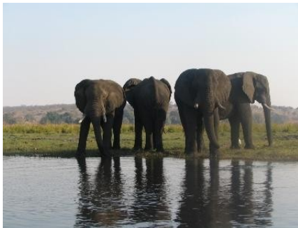
Elefantenbullen am Chobe Fluß

Ü - H/P in der Unterkunft Old House , Kasane